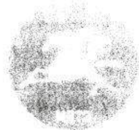
МОСКОВСКИЙ ДЕТСКИЙ ТЕАТР ЭСТРАДЫ

1.10. Учреждение отвечает по своим обязательствам всем находящимся у него на праве оперативного управления имуществом, как закрепленным за Учреждением Собственником, так и приобретенным за счет доходов, полученных от приносящей доход деятельности, за исключением особо ценного движимого имущества, закрепленного за Учреждением или приобретенного Учреждением за счет выделенных средств, а также недвижимого имущества.